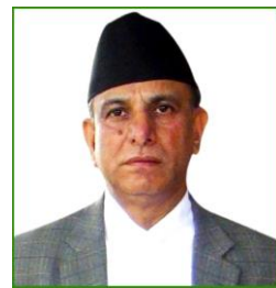
टंकमणि शर्मा, दंगाल महालेखापरीक्षक