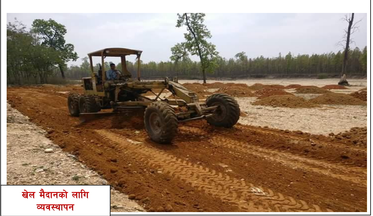
खेल मैदानको लागि व्यवस्थापन