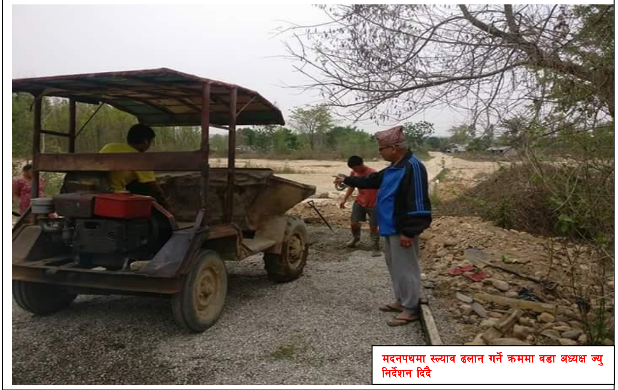
मदनपथमा स्ल्याव ढलान गर्ने क्रममा वडा अध्यक्ष ज्यु निर्देशन दिदै