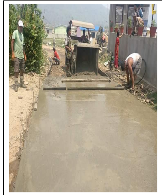
स्ल्याब ढलान दिव्यपथ