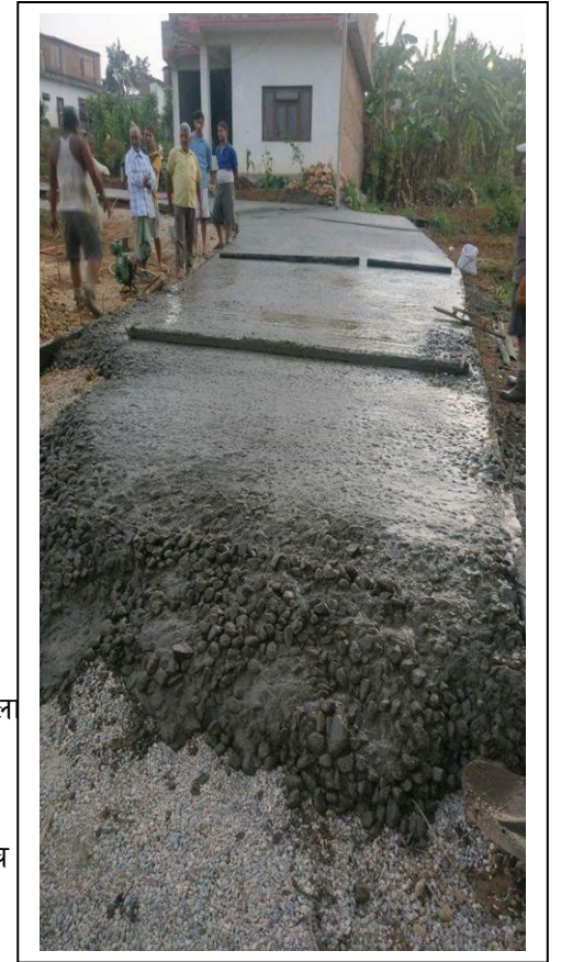
प्रगती टोल सल्याव ढलान)